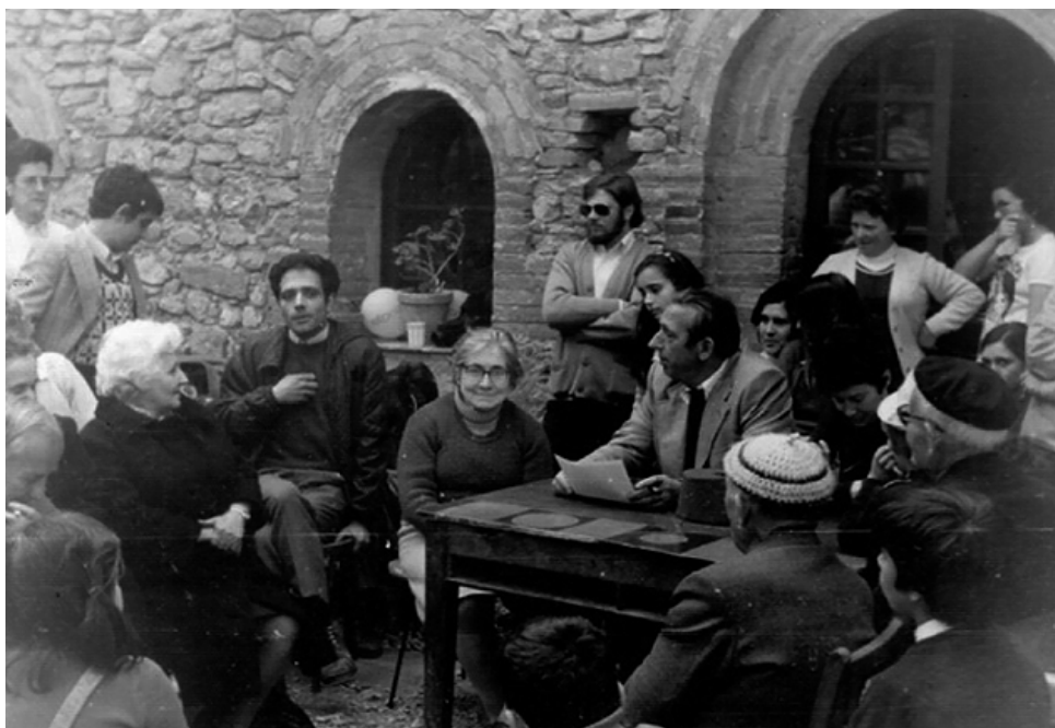
Sortida a Montserrat, on es van anunciar els plans per a la construcció dels locals (1974).

ocórrer a mi) va ser plantejar-lo al revés, mirant el plànol al trasllum, ja que la forma esglaonada de la planta permetia aquest gir per enquibir l'edifici dins del solar. Així és com per fi es va marcar el solar i va començar l'aventura de construir l'edifici. Ja érem a l'estiu de 1974.